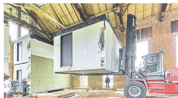
Schritt für Schritt werden die vorgefertigten Raummodule von Timber Homes in die bestehende Gebäudehülle des alten Sumpfhauses integriert.

Auch für Familien wird einiges geboten: Am Montessori-Kindergarten erwartet die kleinen Gäste ein Kinderprogramm mit Hüpfburg, während Eltern die Räumlichkeiten besichtigen können. Ergänzt wird das Angebot durch ein Gewinnspiel mit attraktiven Preisen, darunter Gutscheine für den Escape Room Dorfen und die Kramerei am Kreisel.