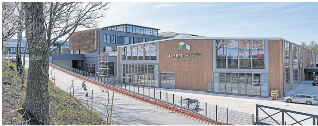
Ebenfalls geöffnet: die Timber Homes Produktion. Während Erwachsene spannende Einblicke erhalten, können junge Gäste beim Vogelhäuschenbau ihr handwerkliches Geschick beweisen.

Auch das Autohaus Christl & Schowalter ist vor Ort und stellt aktuelle Modelle von VW, Škoda und Audi vor – vom Familienauto bis zum Elektrofahrzeug.