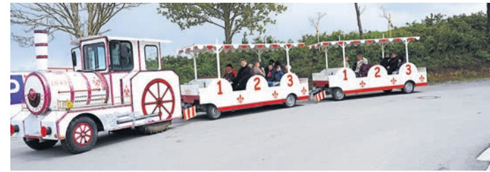
Eine Bimmelbahn verbindet von 11 bis 17 Uhr die einzelnen Stationen auf dem 21 Hektar großen Gelände der alten Ziegelei in Dorfen.