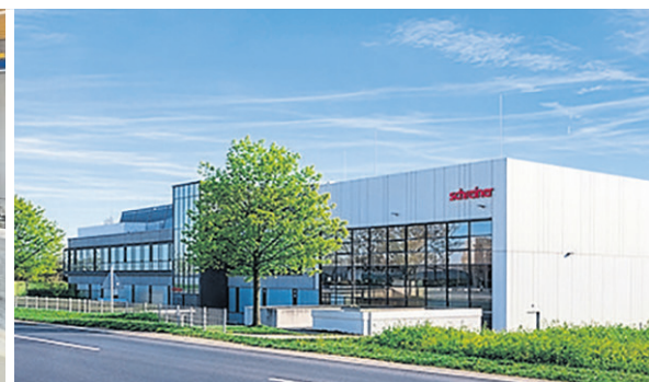
Am Tag der offenen Tür können Besucher das neue Headquarter der Decker Group (Bild links), die Raummodulproduktion von Timber Homes (Bild Mitte) sowie die Hightech-Produktion der Schreiner Group für Spezialetiketten (Bild rechts) kennenlernen. Alle Unternehmen präsentieren zudem ihre aktuellen Jobangebote.