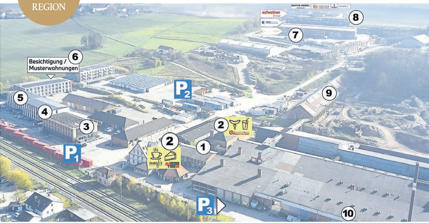
Geländeübersicht mit Nr. 1: Escape Room Dorfen, Nr. 2: Essen & Trinken um die Bricks Bar, molgis und Biergarten U-Bahn, Nr. 3: Boardinghouse Timber ONE (HotelApart4you), Nr. 4: Montessori-Kindergarten/Hüpfburg, Nr. 5: Powerful-Cooling, Kältetherapie, Nr. 6: Musterwohnungen Timber Homes, Nr. 7: Autohaus Christl & Schowalter, Nr. 9: Sanierung Sumpfhäus, Nr. 10: Arno Messedesign,