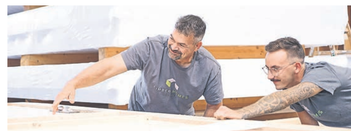
Am Tag der offenen Tür und – und auch online – kann man sich über die vielfältigen Jobangebote bei der Decker Group, Timber Homes und der Schreiner Group informieren. Mehr Informationen sind über die untenstehenden QR-Codes zu finden.